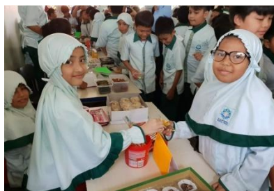
Gambar 4. Kegiatan market day