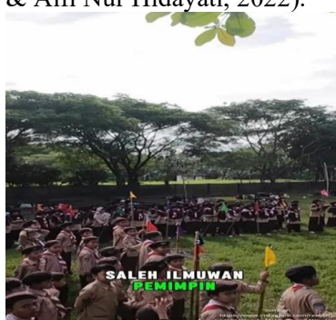
Gambar 2. Kegiatan Pramuka

Gerakan Pramuka berperan sebagai lembaga pembinaan yang memberikan pendidikan nonformal di luar ranah sekolah dengan mengimplementasikan nilai, prinsip, serta metode kepramukaan. Pendidikan tersebut diwujudkan melalui serangkaian kegiatan yang dirancang untuk mengembangkan kemampuan dan karakter peserta didik. Gerakan pramuka terdiri atas kelompok peserta didik dan kelompok pendidik atau pembina. Kelompok peserta didik dimulai dari tingkatan pramuka Siaga, Penggalang, Penegak, dan Pandega. Sedangkan untuk kelompok pendidik mencakup Pembina, Asisten Pembina Pramuka, Pamog Saka, dan lain sebagainya. (Kwartir Nasional, 2010 dikutip dalam (Midya Yuli Amreta & Alfi Nur Hidayati, 2022).