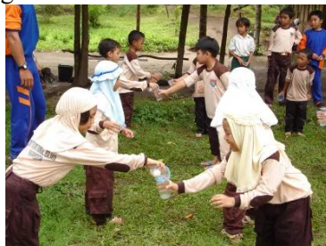
Gambar 3. Kegiatan Outbound

rutinitas sekolah seperti menanam tanaman di kebun dan kemudian mengolah hasil panennya, siswa juga dilatih untuk bertanggung jawab dan berkreasi, di mana mereka dibagi ke dalam beberapa kelompok untuk menyiapkan hidangan sederhana.