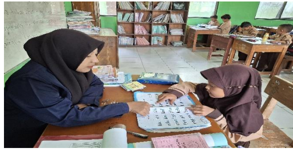
Gambar 1. Membaca Dengan Lancar

Berdasarkan pada penelitian ada beberapa siswa yang belum lancar dalam membaca seperti siswa MGA dan SH dalam hal ini belum menguasai kelancaran membaca. Mereka sering terbata-bata, ragu saat mengeja kata, bahkan kadang salah menyuarakan huruf atau suku kata, Sering terjadi pengulangan dan kesalahan dalam mengeja kata sehingga perlu bimbingan intensif dan latihan harian untuk memperbaiki kelancaran membaca.