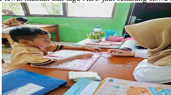
Gambar 3. Mengenali Huruf secara Visual

Berdasarkan hasil tes dan wawancara peneliti sebagian besar siswa telah mampu mengenali huruf A sampai Z secara visual. Dalam proses observasi, siswa dapat menunjukkan huruf yang diminta dan menyebutkannya dengan benar namun ada beberapa siswa masih tertukar antara huruf yang bentuknya mirip seperti "b" dan "d" atau "p" dan "q". Guru menyatakan pengenalan huruf sudah diberikan sejak semester pertama dengan media yang bervariasi, contohnya seperti kegiatan menebalkan dan menyalin huruf dan menunjukan kartu huruf ini sangat efektif meningkatkan kemampuan visual siswa. Menurut pendapat walimurid saat di wawan carai sejak TK, siswa sudah sering mengenalkan huruf lewat mainan dan lagu ABC jadi sekarang siswa sudah hafal huruf.