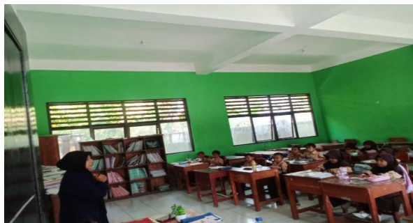
Gambar 6. Antusias Mengikuti Kegiatan Membaca

Berdasarkan hasil tes dan wawancara secara umum, siswa menunjukkan antusiasme tinggi saat mengikuti kegiatan membaca. Mereka tampak senang saat guru membacakan cerita, berebut giliran membaca, dan aktif menjawab pertanyaan. Guru menyebutkan beberapa siswa sangat semangat saat diberikan kesempatan membaca di depan kelas aktivitas membaca yang dikemas dengan metode bercerita, bermain peran, dan membaca bergiliran meningkatkan minat siswa terhadap kegiatan membaca. Pada saat wawancara wali murid bahwa siswa suka minta dibacakan cerita, apalagi kalau gambarnya lucu siswa juga semangat kalau disuruh membawa buku dari rumah untuk membaca di kelas.