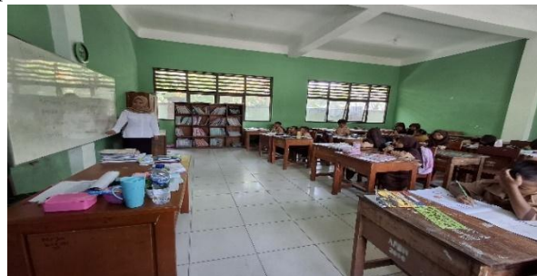
Gambar 7. Berpartisipasi Aktif dalam Kegiatan Literasi

Berdasarkan pada saat penelitian siswa MGA, SH, SNH, dan AR mengikuti kegiatan literasi seperti membaca buku cerita, mendengarkan guru membaca, atau melihat pajangan literasi, tetapi secara pasif hanya mengikuti jika diarahkan guru, tidak berinisiatif untuk membuat karya literasi sendiri seperti menggambar isi cerita, menulis ulang cerita, atau membuat kesimpulan bacaan siswa mengikuti kegiatan membaca bersama, tetapi tidak tertarik untuk menggambar isi cerita diperlukan stimulus yang lebih menyenangkan dan sesuai minat mereka, seperti kegiatan menggambar cerita, bermain peran dari isi bacaan, atau membuat pojok baca.