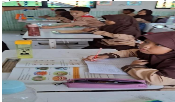
Gambar 2. Menjawab Pertanyaan Dari Hasil Bacaan

Berdasarkan hasil tes dan wawancara sebagian siswa mampu menjawab pertanyaan yang berkaitan langsung dengan isi bacaan. Misalnya, setelah membaca teks, mereka dapat menjawab "kebun kakek ditanami apa?" atau "apa pekerjaan kakek?". Hasil observasi menunjukkan bahwa siswa pada saat pertanyaan mulai mengarah pada kesimpulan atau inferensi, siswa cenderung bingung. Dalam wawancara guru menjelaskan bahwa siswa lebih responsif ketika ditanya secara langsung setelah membaca bersama ini menunjukkan bahwa keterampilan menjawab pertanyaan literal sudah berkembang, tetapi keterampilan berpikir kritis masih perlu dilatih. Pada saat wawancara wali murid menunjukkan bahwa siswa jarang ditanya isi bacaan di rumah, sehingga kurang terbiasa menguraikan makna bacaan, ketika siswa di tanya ceritanya tentang apa? tapi siswa menjawab dengan singkat, belum bisa cerita panjang tapi setidaknya siswa tahu intinya dari bacaan yang siswa baca.