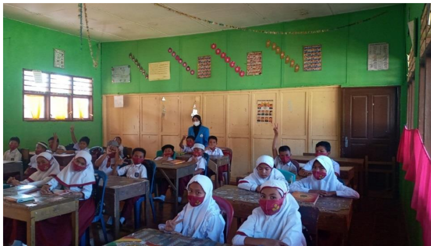
Gambar 4. Suasana keberlangsungan kegiatan