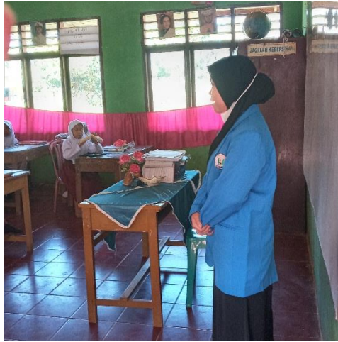
Gambar 2. Pembukaan Sosialisasi