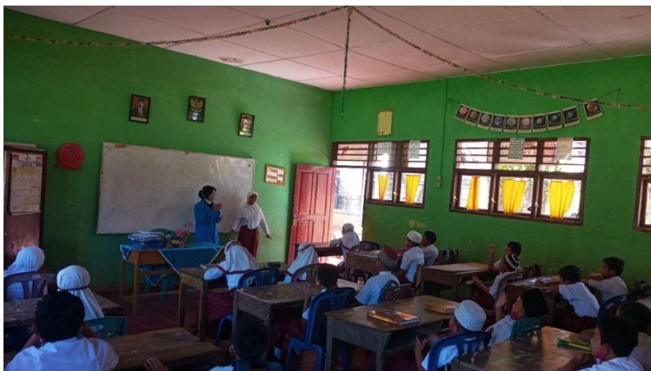
Gambar 3. Menjelaskan penerapan pentingnya menjaga kebersihan